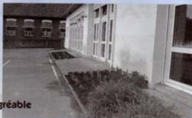
un accueil agréable