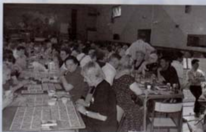
une salle comble pour le loto

Maire adjointe à la jeunesse et à l'enseignement