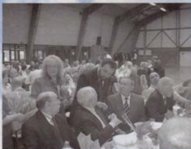
quand les anciens sont mis à l'honneur

Le social contrôlé pour éviter les dérives de l'assistanat. Un Centre Communal d'Action Sociale totalement rénové dans sa représentation.