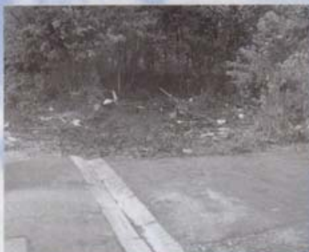
des travaux nécessaires