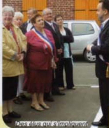
Des élus qui s'impliquent

Au service de tous, avec prochainement la permanence d'une conciatrice de justice.