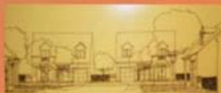
VUE DES MAISONS