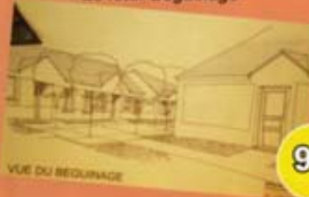
VUE DU BÉGUINAGE