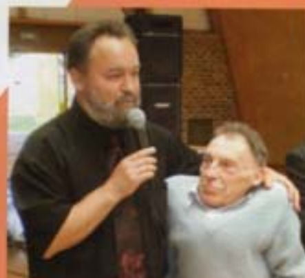
Honneur à nos anciens