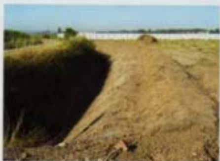
L'aménagement du terrain