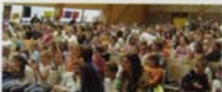
Fête des écoles