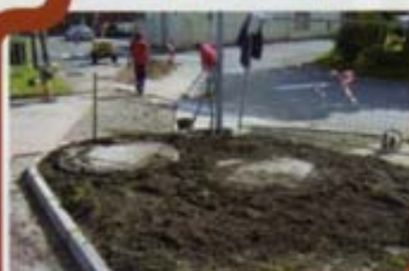
Adduction d'eau au stade