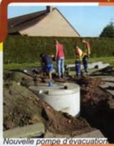
Nouvelle pompe d'évacuation