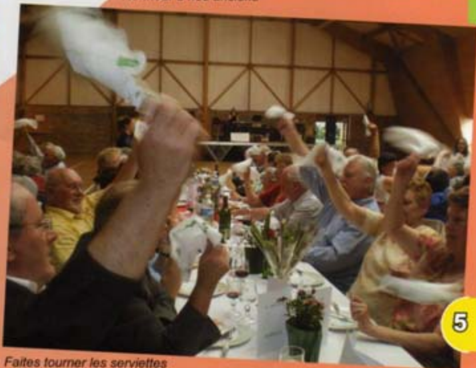
Faites tourner les serviettes