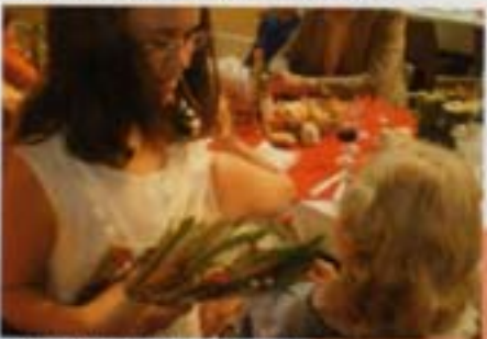
La distribution du muguet