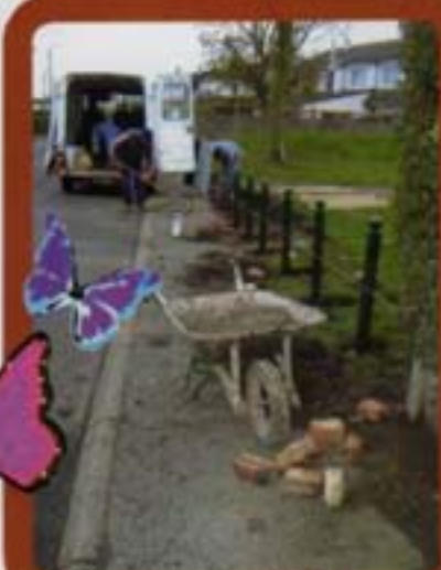
Clôture d'espace vert