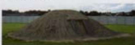
Le tumulus et la porte