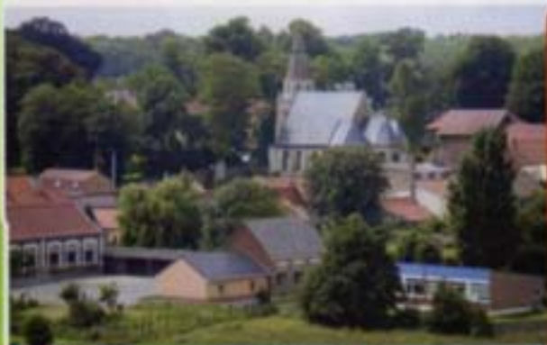
Nouvelles toilettes de l'école