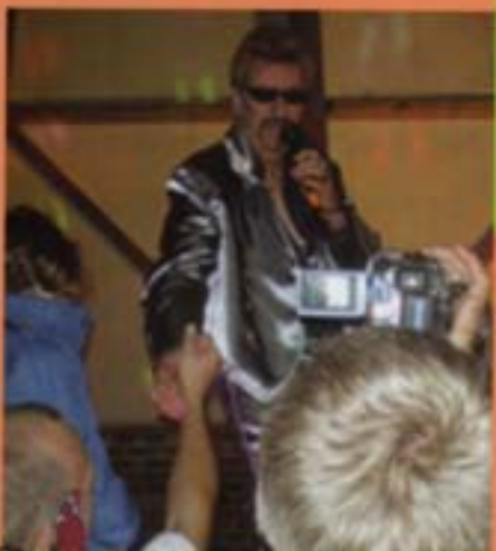
la St Jean