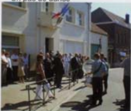
L'harmonie devant la mairie