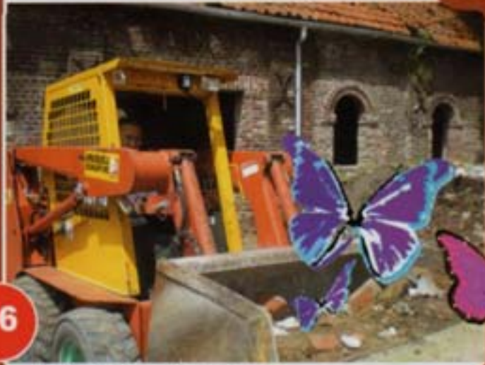
La future salle des mariages