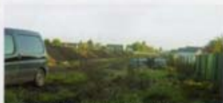
Résidence de la Bombarde