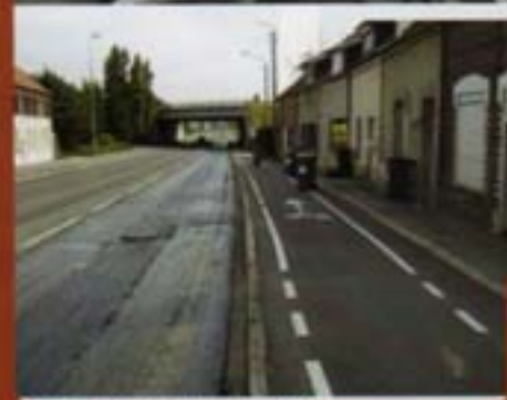
Feux route nationale