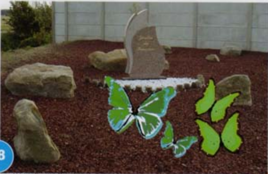
Le jardin du souvenir