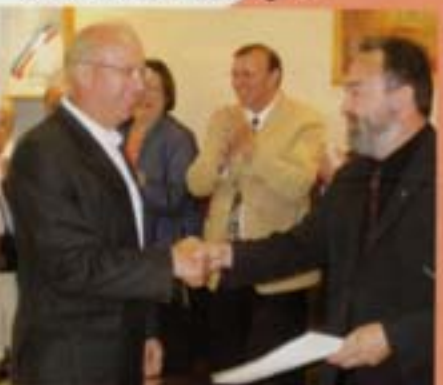
Médaille du travail