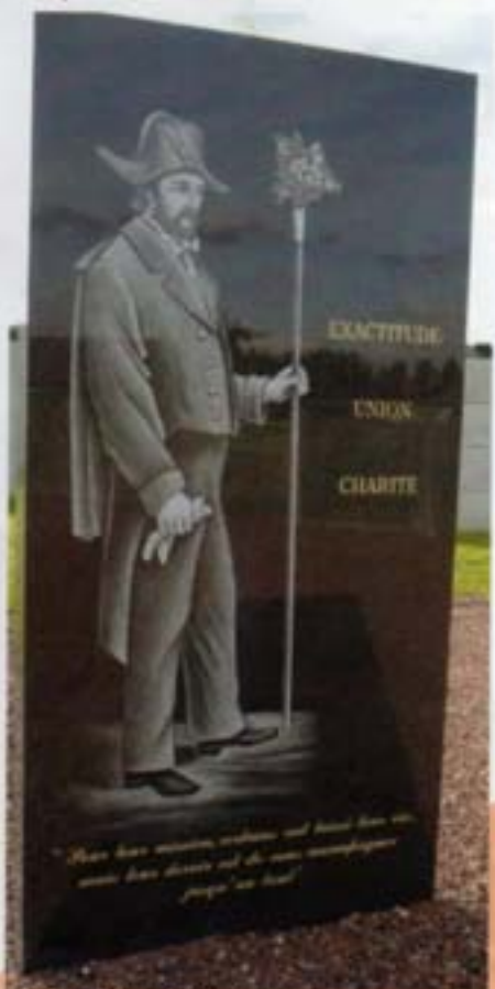
La stèle des Charitables