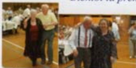
Un pas de danse