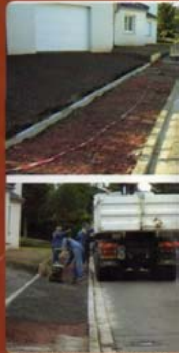
Trottoir de la rue Jules Verne