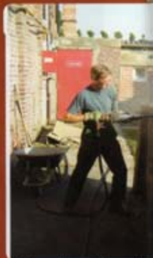
Rénovation de la salle