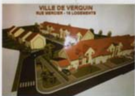
La future résidence rue Mercier

Pas d'augmentation d'impôts depuis 2001. L'environnement