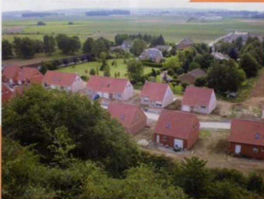
La nouvelle résidence Vipérine

Bientôt, rue Mercier avec Pas de Calais Habitat et aux Paturelles, de nouvelles constructions vont sortir de terre.